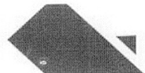
Philipe Theophilo Nottingham Secretário Municipal do Planejamento, Orçamento e Gestão